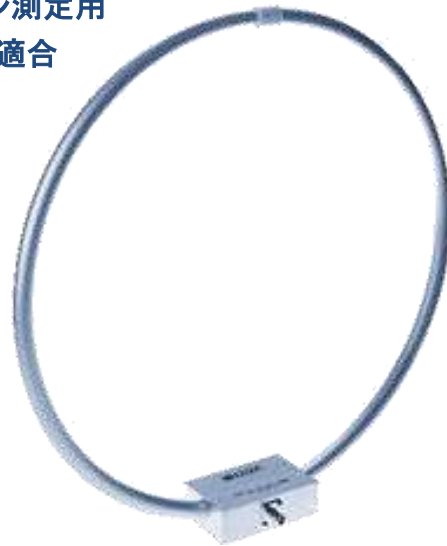
パッシブループアンテナ 6511 : 20Hz~5MHz 6512 : 10K~30MHz