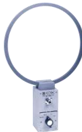
6509 パッシブループ 1KHz~30MHz