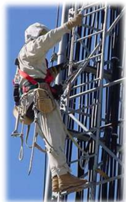
KW-Gard を装着しての作業