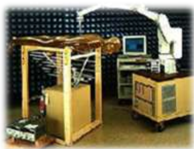
SAR 測定による評価 (ファントムに装着)