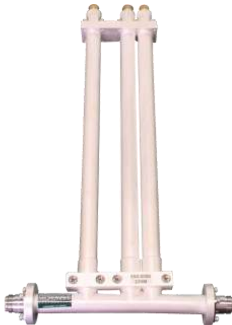
Model 592.0006 3Stub Tuner 仕様