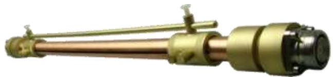
スラグチューナー(150MHzより)