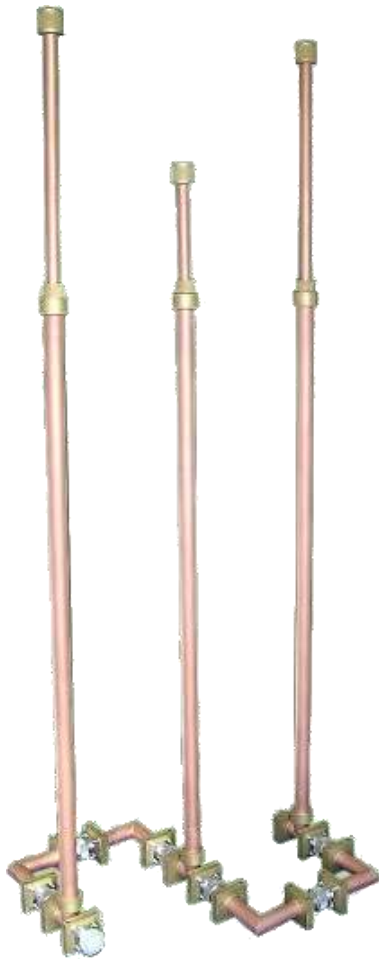
3 スタブチューナー(150MHzより)